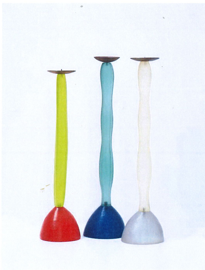
Bougeoir Benazir de Migeon & Migeon